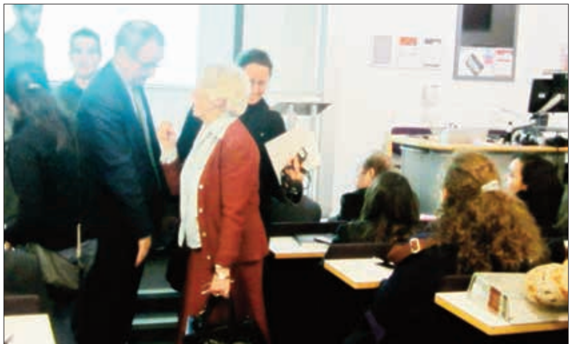
La Baronessa Gloria Hooper asistió al evento. Ella es abogada y miembro de la Cámara de los Lores.