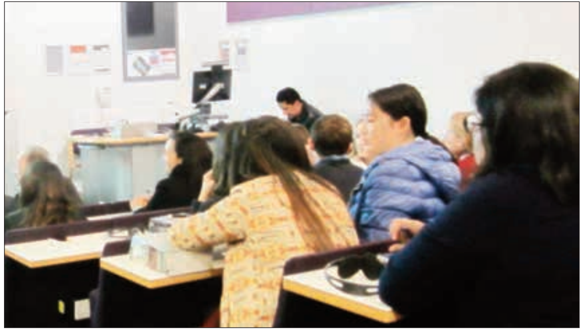
Abogados de diferentes nacionalidades asistieron para escuchar a una las partes en uno de los procesos litigiosos más complejos de la historia del arbitraje internacional.

La preocupación de los asistentes por los afectados y el medio ambiente no sorprende porque ante la comunidad internacional el caso Chevron con sus múltiples controversias que a manera de hidra