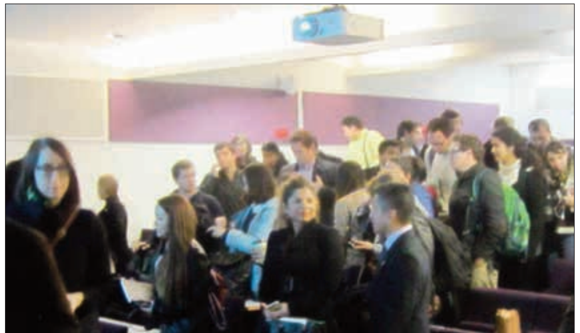
Una toma de los asistentes, muchos de ellos estudiantes universitarios haciendo su maestría o doctorado.