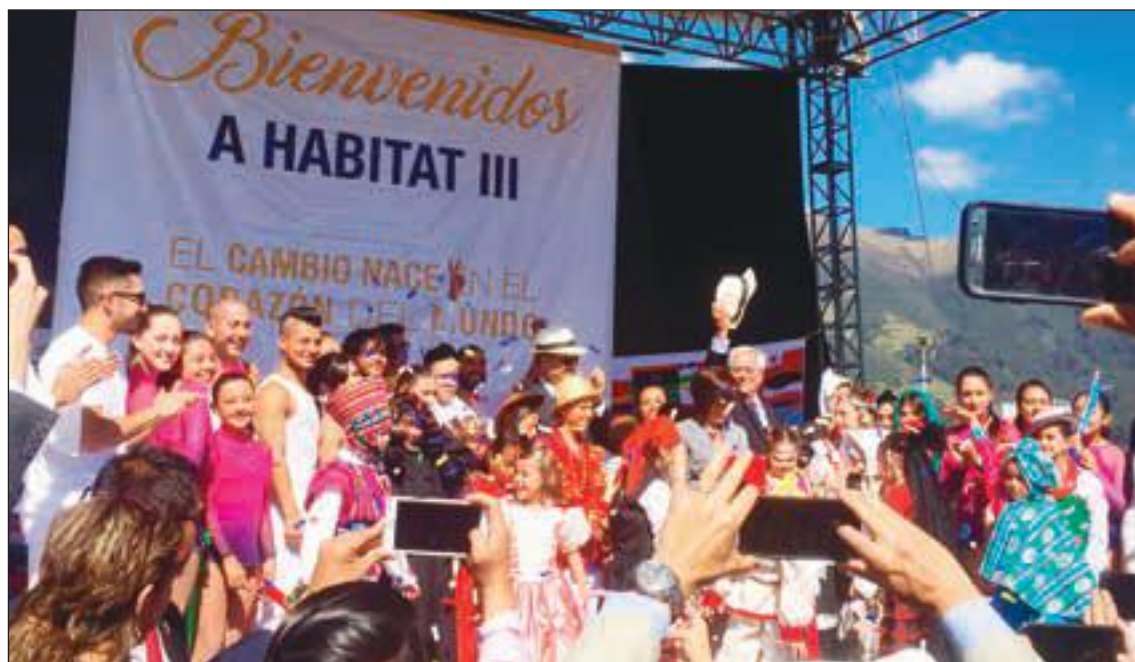
Inauguración de la Conferencia de las Naciones Unidas sobre Vivienda y Desarrollo Urbano Sostenible "Habitat III"