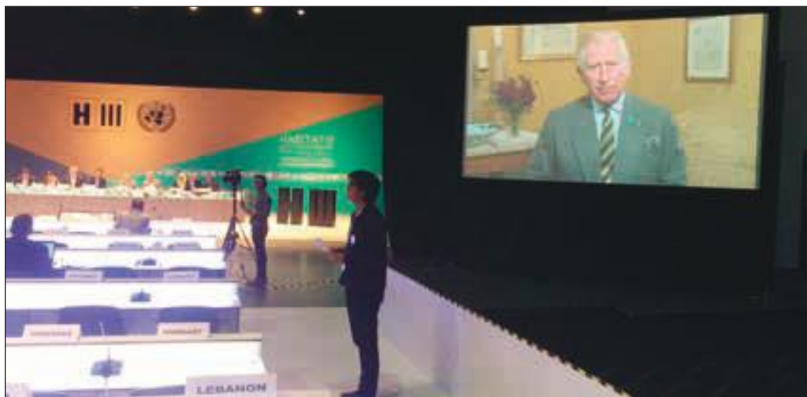
El príncipe Carlos se dirige a la audiencia en Hábitat III

Eso sin mencionar actos culturales paralelos y conferencias alternativas organizadas por las