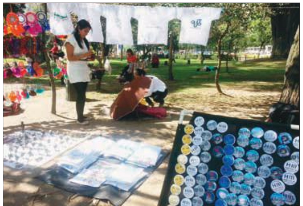
Los comerciantes aprovecharon el evento para vender recuerdos alusivos a la cumbre mundial.