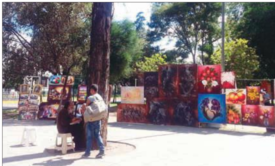
Los artistas también aprovecharon la gran concurrencia a Habitat III para exponer y vender sus obras.

universidades ecuatorianas. La diversidad de las convocatorias reflejó la complejidad del tema de la concentración de la gente en las ciudades, las ventajas y desventajas que esto acarrea.