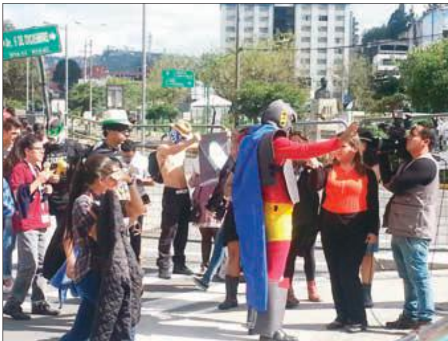
No faltaron las protestas de ecuatorianos que se sintieron excluidos del evento.