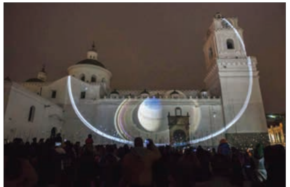
La fiesta de la Luz frente a la Iglesia de la Merced.