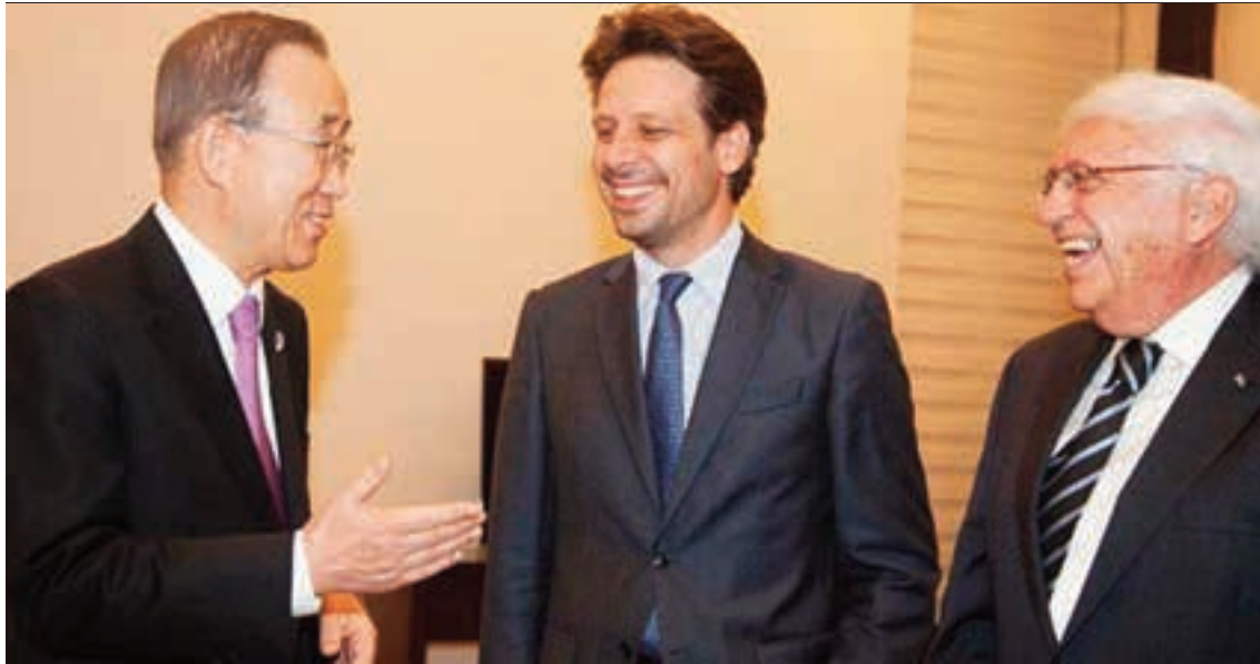
En la sala VIP de Tababela se encuentran, el Secretario General de la ONU, el Canciller Long y el Embajador Horacio Sevilla.

del arte. La Fiesta de la Luz se proyectó igual en la capilla del Museo de la Ciudad, en el Centro Cultural Metropolitano, en la Plaza del Teatro y en la Plaza Hermano Miguel (San Blas).