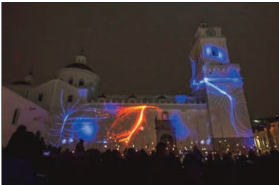
La fiesta de la Luz frente al Carmen Alto.