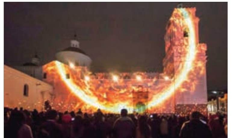
La iglesia de la Merced recibió, varios tipos representativos de luces que recibieron aplausos y admiración de los turistas y nacionales presentes.

El borrador del documento contiene 175 puntos entre los que se destacan acuerdos para lograr la inclusión y la erradicación de la pobreza, el éxito económico de las urbes con oportunidades para todos, y el crecimiento de ciudades amigables con el ambiente y capaces de adaptarse y enfrentar cambios producidos por fenómenos naturales. La hoja de ruta también incluye acuerdos para promover el uso sostenible de la tierra, conteniendo la expansión de las zonas urbanas y evitando la pérdida de áreas productivas y ecosistemas frágiles.