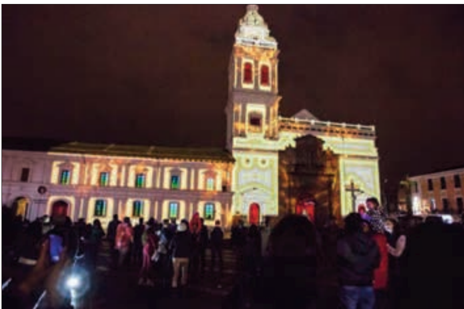
La Fiesta de la Luz se proyectó en varias iglesia quiteñas y museos, en honor de la conferencia Mundial de Habitat III. En la gráfica en la iglesia de San Francisco.

Sobre la fachada blanca del convento de Santo Domingo, en las calles Rocafuerte y Maldonado, las luces trazaron un viaje por tres mundos: imágenes precolombinas, barrocas y contemporáneas. Miles de visitantes han ocupado en estos días la plaza de acceso al templo, al pie de El Panecillo, para disfrutar