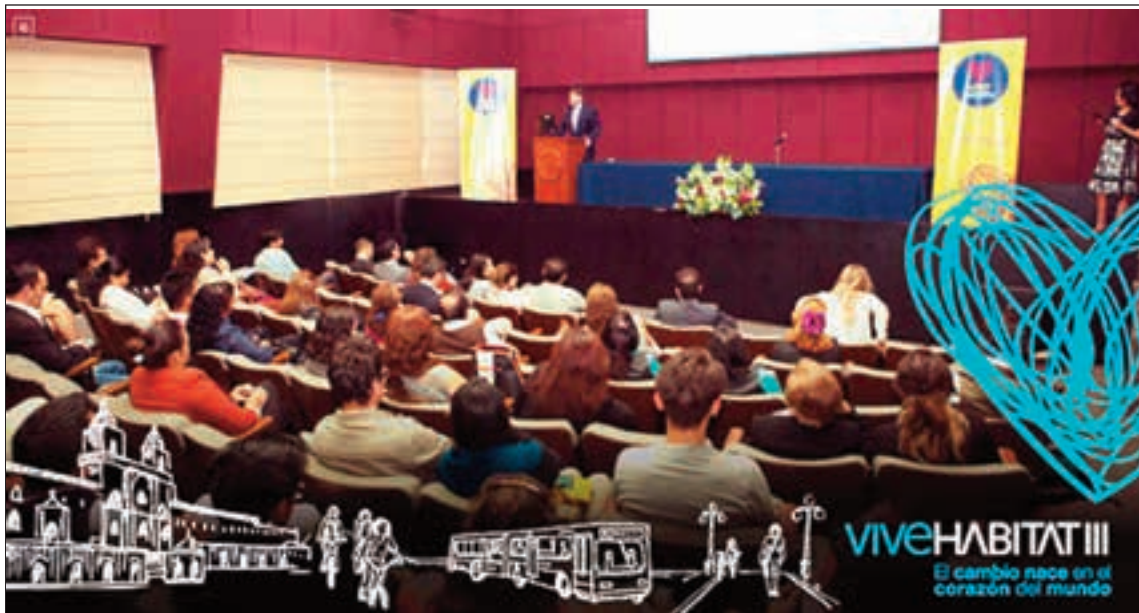
Una de las reuniones preparatorias de Habitat III.

Estos días, los turistas han podido ingresar al Museo de la Ciudad desde las 11:30 hasta las 00:00. El Museo del Carmen Alto, en cambio, está abierto desde las 11:00.