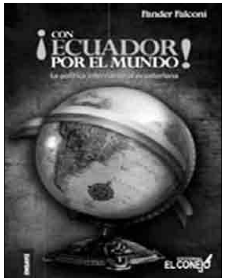
Portada del libro Con Ecuador por el Mundo de Fänder Falconí.

Propaganda del evento que creó mucha expectativa entre académicos e intelectuales británicos