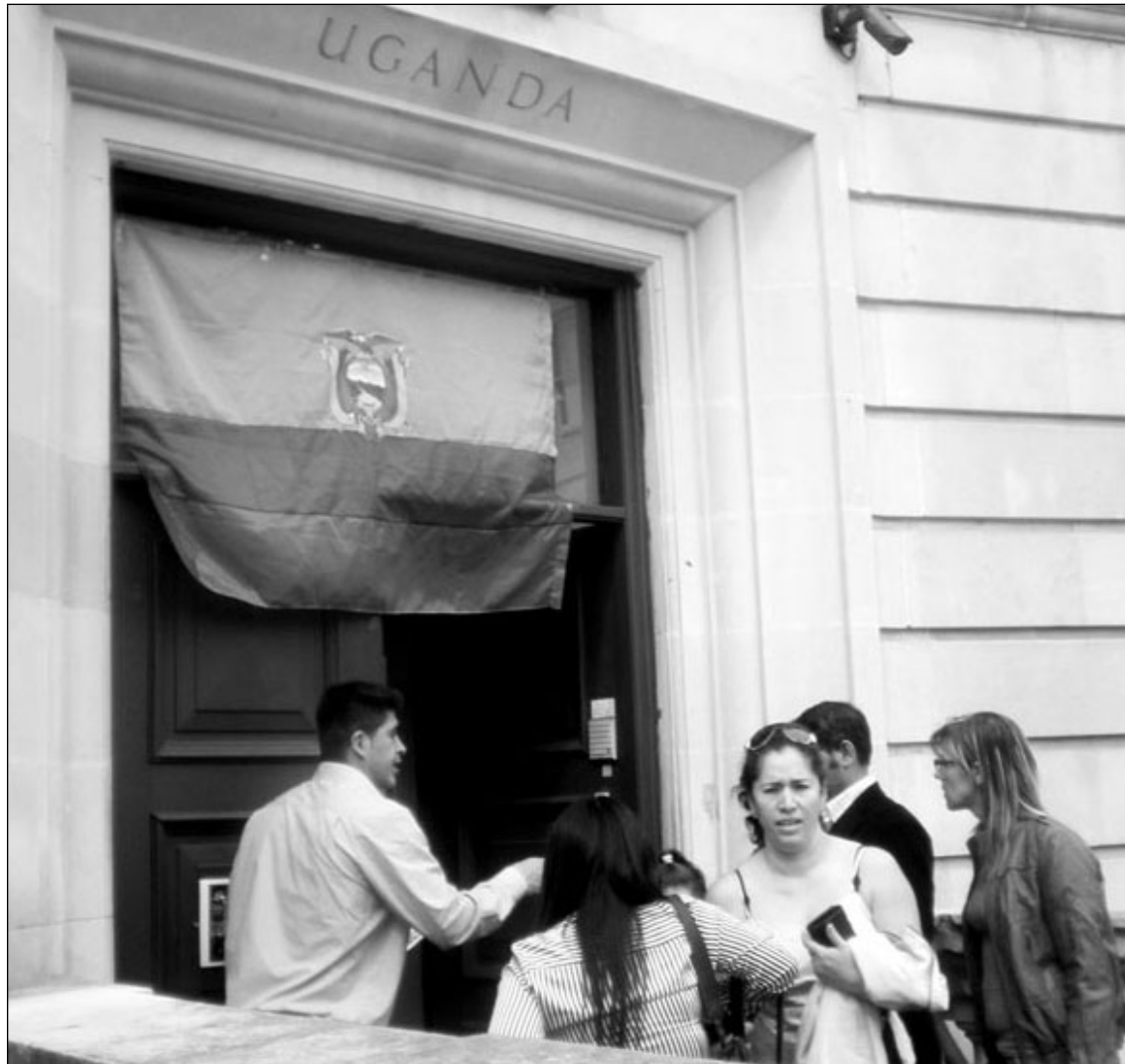
toma de la parte posterior de Uganda House, el edificio donde está ubicado el consulado ecuatoriano