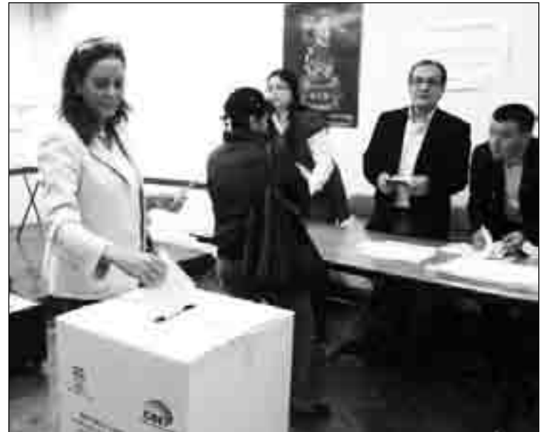
Ana Albán Mora, Embajadora de Ecuador sufragando

resultados que constan en la página web del consulado, los ciudadanos ecuatorianos olvidaron. Si bien es cierto el número de empadronados es casi el doble del que hubo en Abril de 2009 sin embargo también en estos comicios se registró un alto nivel de ausentismo el cual no sólo entristece el proceso democrático sino que además es un desperdicio de recursos.