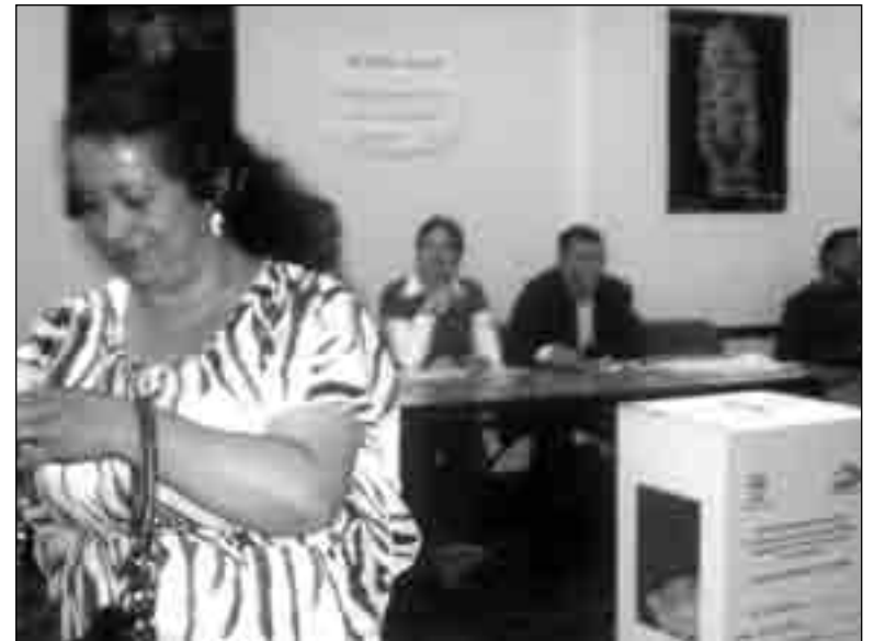
Ecuatoriana satisfecha por haber ejercido su derecho al voto