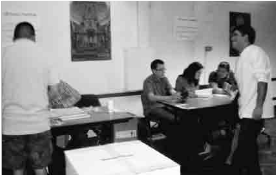
ecuatorianos contentos ejercen su derecho al voto

Padrón Electoral 1727 Total de votantes 749 (43%) Ausentismo 978 (57%)