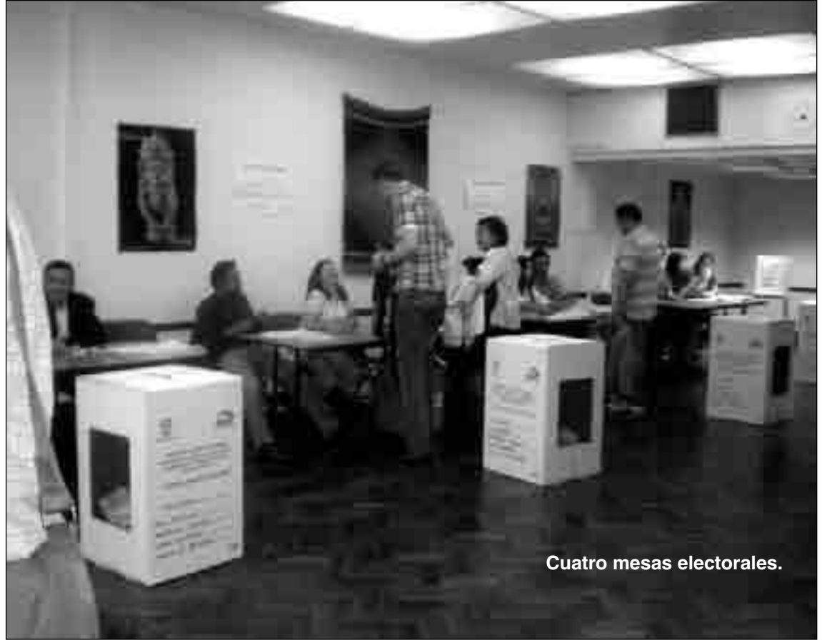
Cuatro mesas electorales.