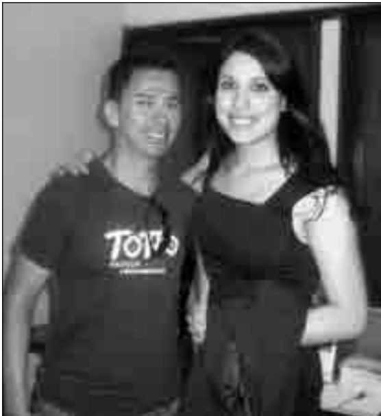
Miss Ecuador-UK junto a un promotor de la Biblioteca ecuatoriana

venido muchos y también estuvo la embajadora más o menos a las 8". Este joven apenas tiene 6 meses en Londres y ya estaba trabajando como voluntario entregando papeletas con el contenido de las preguntas a los sufragantes, quienes tuvieron que ingresar por la puerta posterior del edificio; ya que al ser sábado, la entrada principal de Uganda House estaba cerrada.