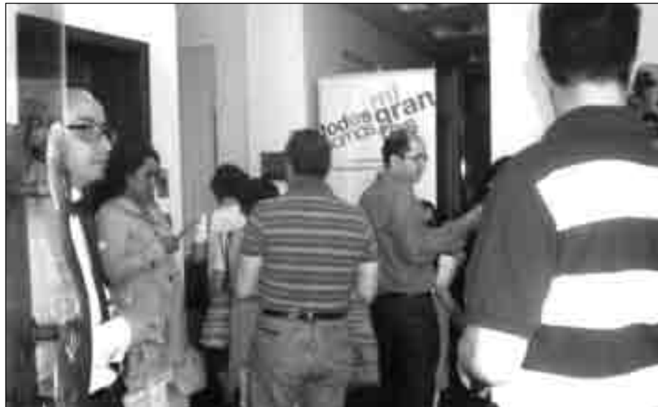
Ecuatorianos en el hall de ingreso para votar en la consulta popular.