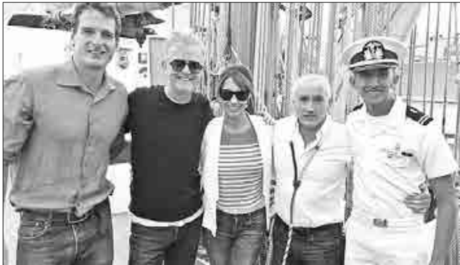
Dan Snow, Chris Evans, Alex Jones, Barry MacGuigan de uno de los programas estelares de la televisión británica "The One Show", se toman una fotografía con un oficial del buque insignia de la marina ecuatoriana.