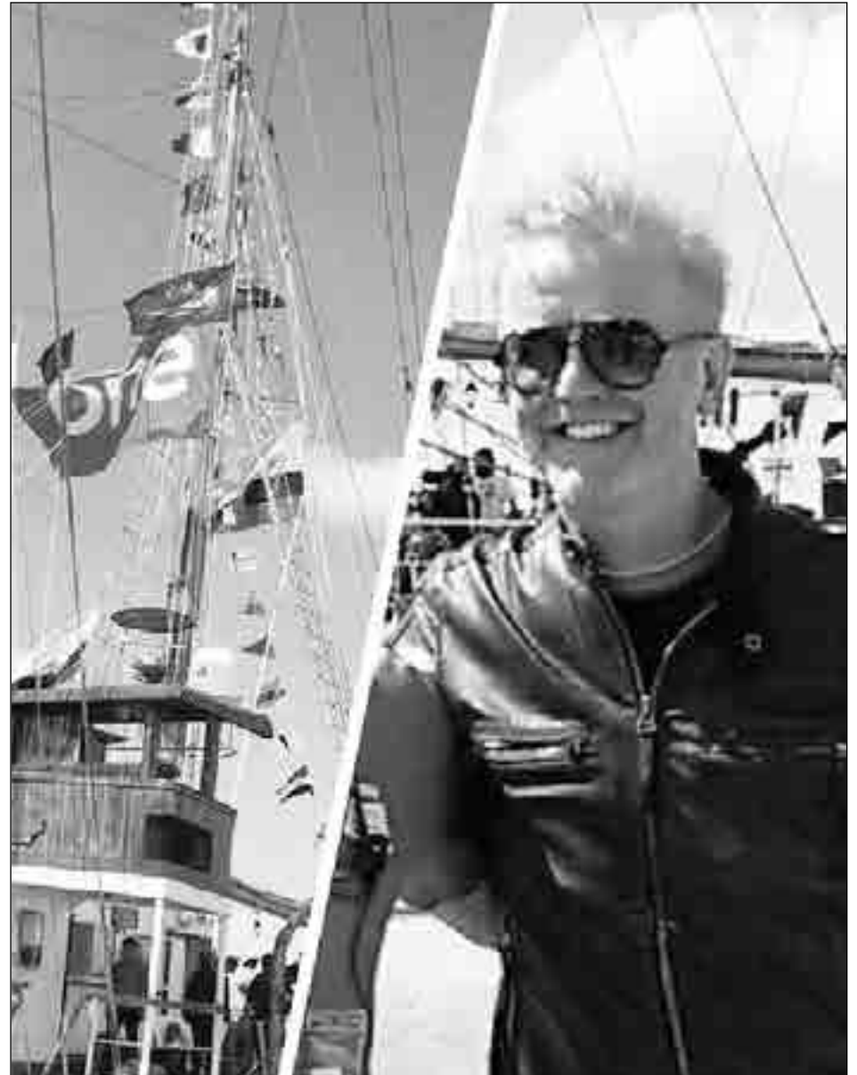
Chris Evans, uno de los mejores presentadores de la televisión británica, dejó un recuerdo agradable entre los tripulantes del Buque Guayas.