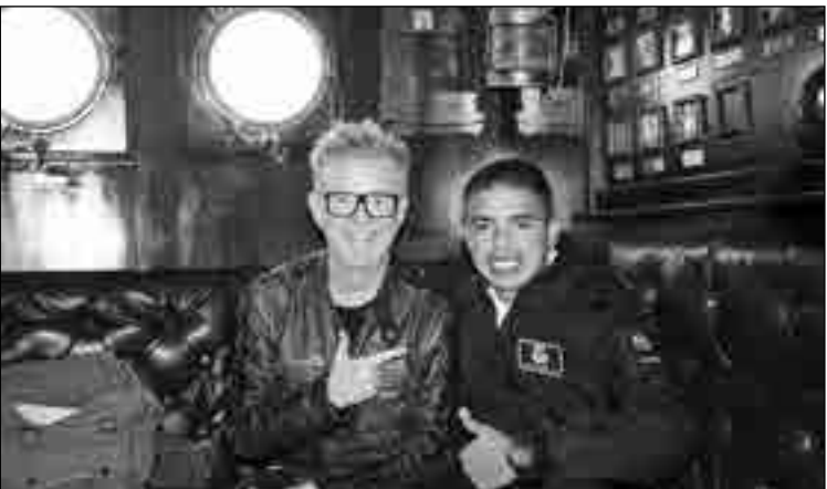
Chris Evans, quien hace poco fue escogido para ser el nuevo presentador del famoso programa "Top Gear", no pudo ocultar su entusiasmo al transmitir desde el Buque Escuela Guayas y dijo que este era el programa favorito de los que él ha grabado fuera de estudios.

Ecuador, aparejado como bricbarca.2 Botado en 1976, fue nombrado en forma conjunta en honor al Río Guayas y al vapor Guayas,