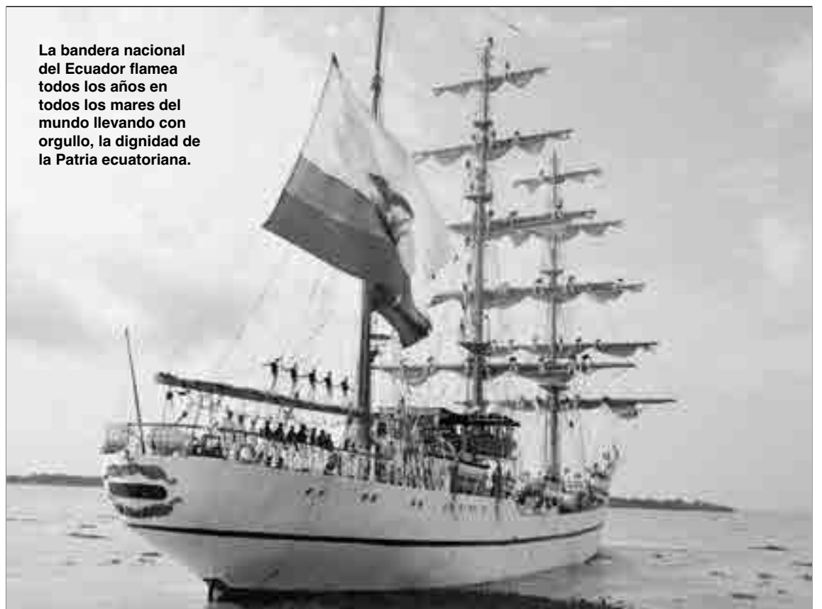
La bandera nacional del Ecuador flamea todos los años en todos los mares del mundo llevando con orgullo, la dignidad de la Patria ecuatoriana.