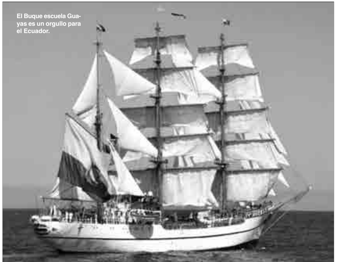
El Buque escuela Guayas es un orgullo para el Ecuador.

El BAE Guayas es un buque escuela a vela de la Armada del