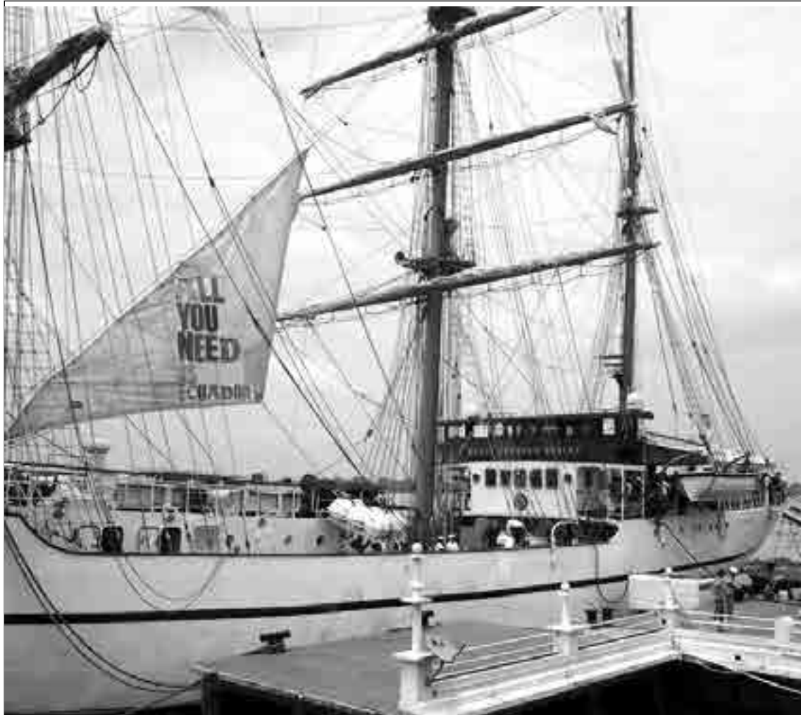
Ahora el Buque Escuela Guayas lleva en su frente el eslogan de la campaña de turismo del país "All you need is Ecuador".