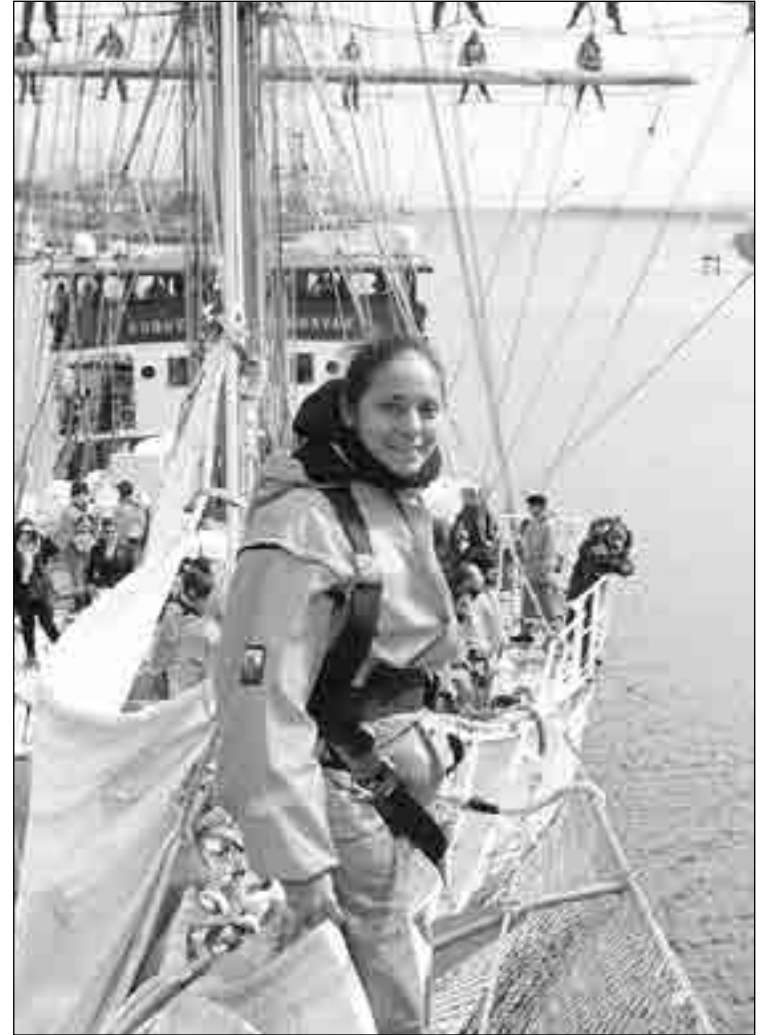
Una bella tripulante ecuatoriana del Busque Escuela Guayas.