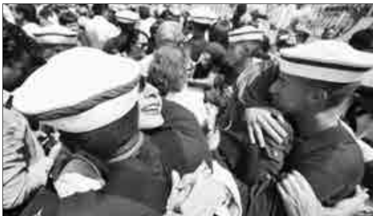
Después de varios meses de viaje al regreso a Guayaquil, los parientes, especialmente las esposas reciben con cariño a sus seres queridos.