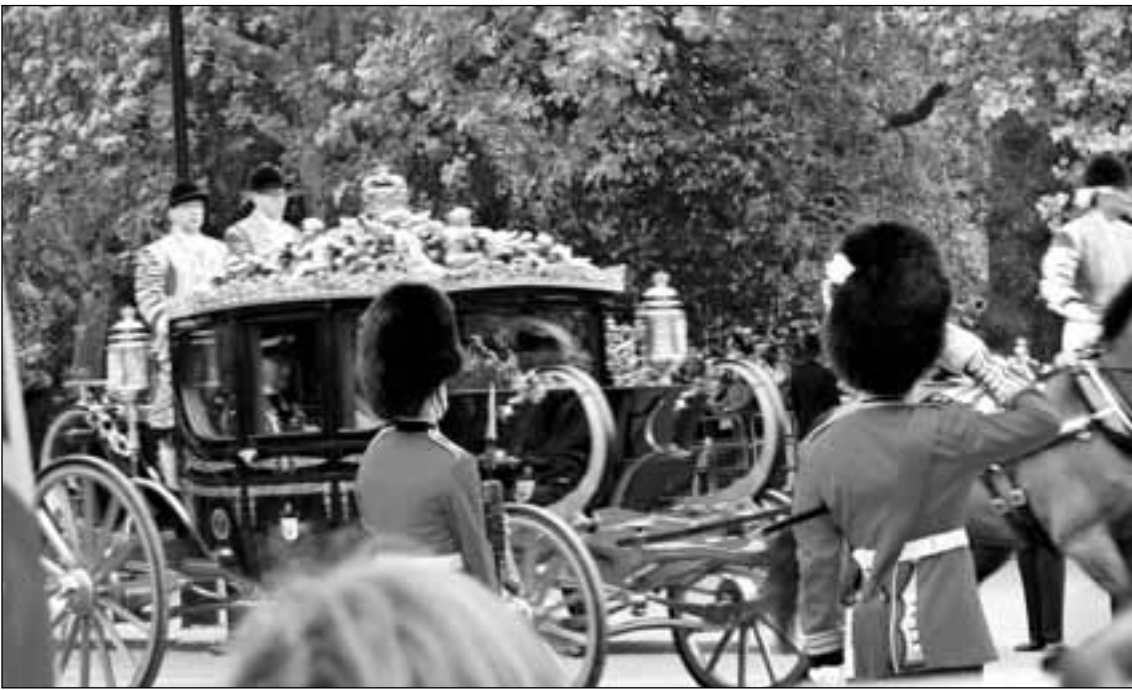
Carroza real en su interior el Príncipe Carlos y su esposa Camila Parker

Desde la Edad Media, el Lord Chamberlain, el más alto funcionario de la Casa Real, cumple un papel fundamental en la celebración de los eventos que implican