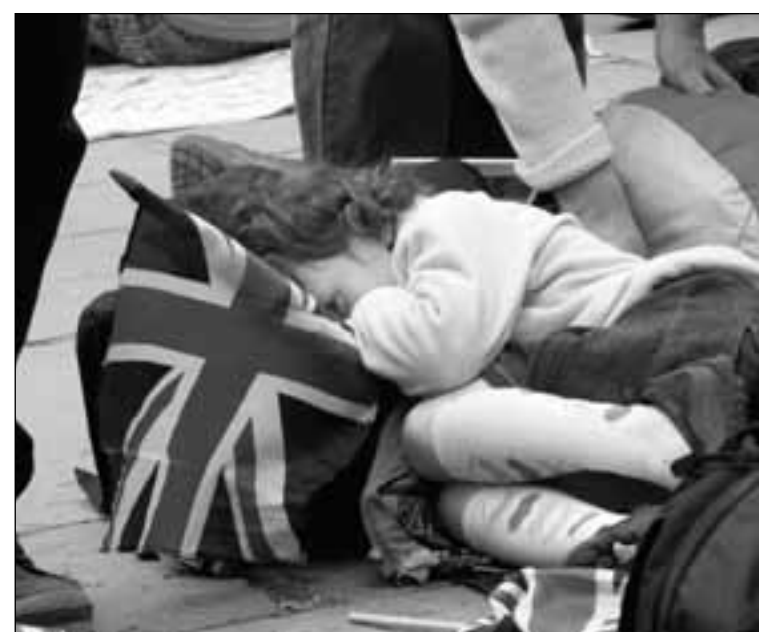
Una pequeña espectadora cansada. Derecha, presentador de NBC News