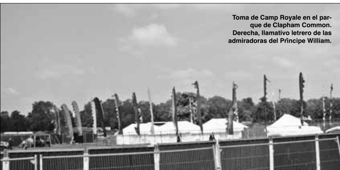
Toma de Camp Royale en el parque de Clapham Common. Derecha, llamativo letrero de las admiradoras del Príncipe William.