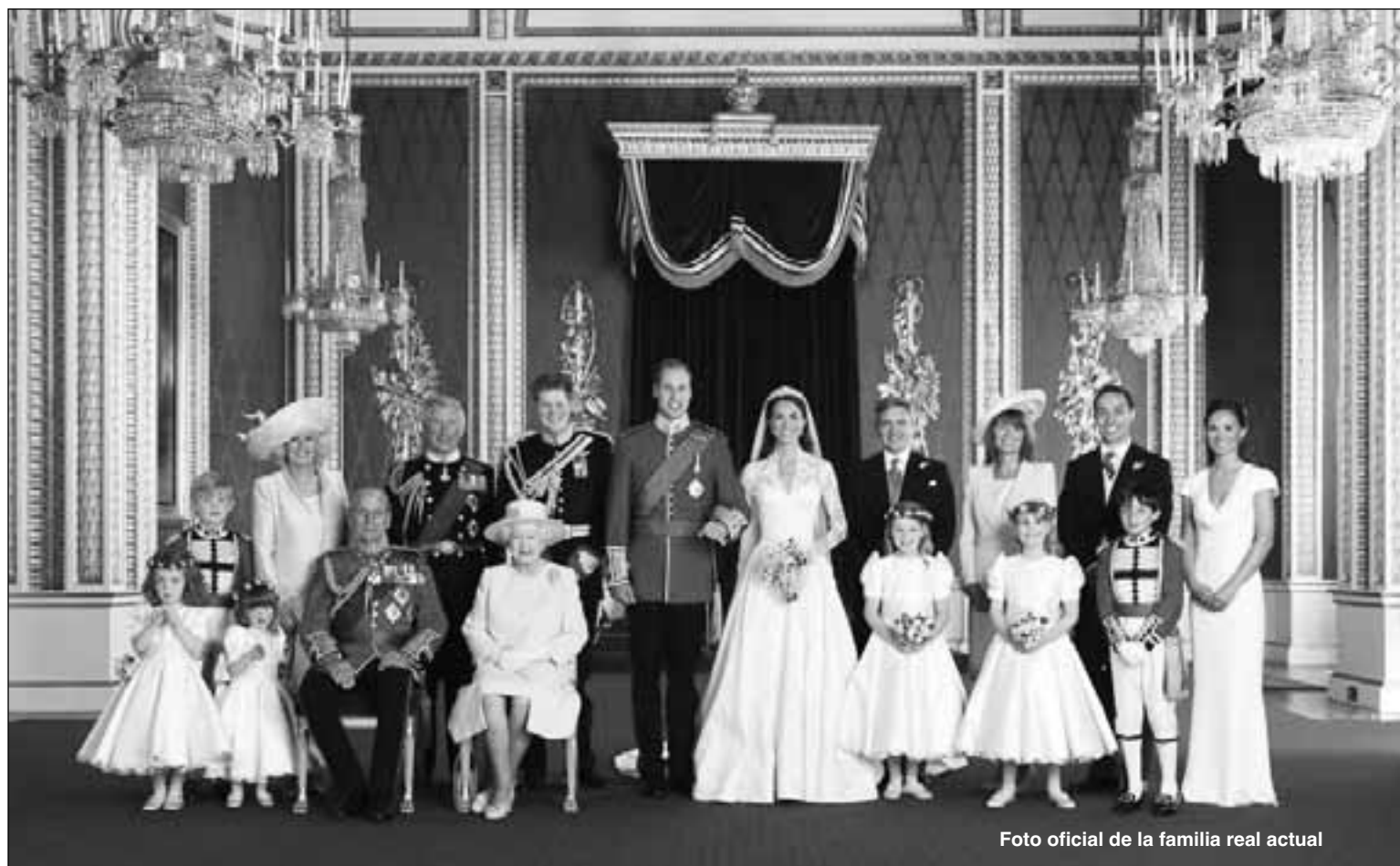
Foto oficial de la familia real actual

Para muchos este acontecimiento fue muy lucrativo; para otros la celebración de un evento de esta magnitud no es propicio en época de austeridad y acusaron a la monarquía de indolente al celebrar una boda en momentos