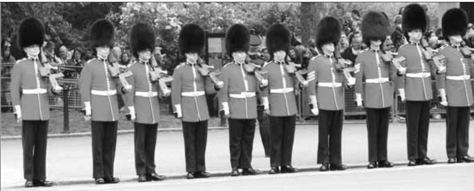
La Guardia Real lista para el paso de las carrozas, con idéntica solemnidad de cuando están frente al Palacio.