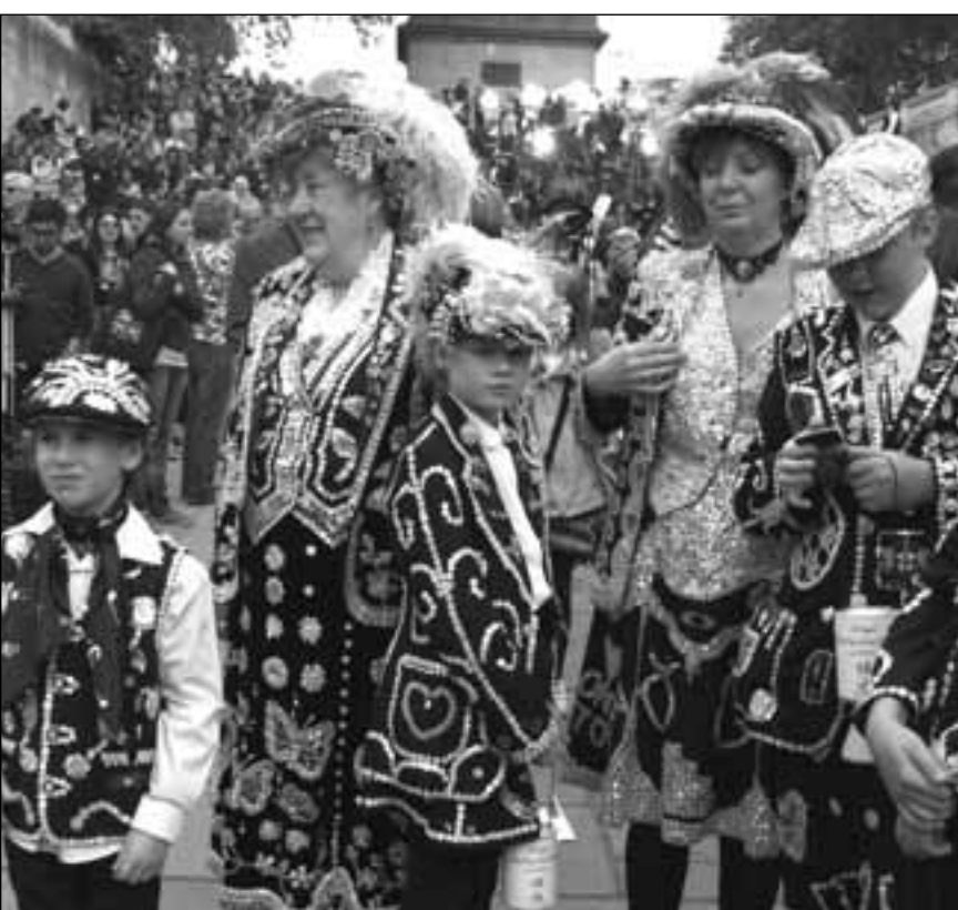
Los tradicionales personajes Pearly Queen y King estuvieron presentes. Derecha, Algunas damas invitadas saliendo con la invitación real en mano