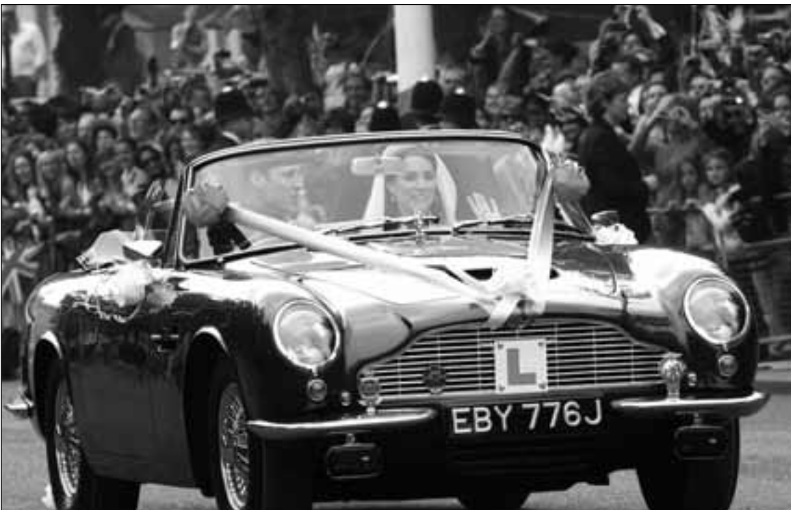
Los recién casados en un fabuloso Austin Martin.

El Príncipe William nació el 21 de junio de 1982. Es el hijo mayor del Príncipe Carlos y la venerada Princesa de Gales, Diana. Cuando su madre falleció el tenía 15 años. Estudió en el prestigioso