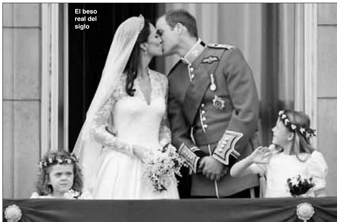
El beso real del siglo

A su paso más de un millón de espectadores expresaron sus felicitaciones a la pareja real que jubilosamente saludaba a los británicos y extranjeros que se encontraban aglutinados en Parliament Square, Whitehall, Horse Guards Parade, The Mall y en los alrededores de la residencia de la reina, quien ofreció una recepción. Después de la recepción la pareja puso un toque de modernidad y sorprendió al público al salir del Palacio de Buckingham en un Austin Martin decorado con la frase "recién casados" en ese auto que fue un regalo que Diana dio a Guillermo cuando él cumplió 21 años, se fueron a Clarence House a cambiarse para