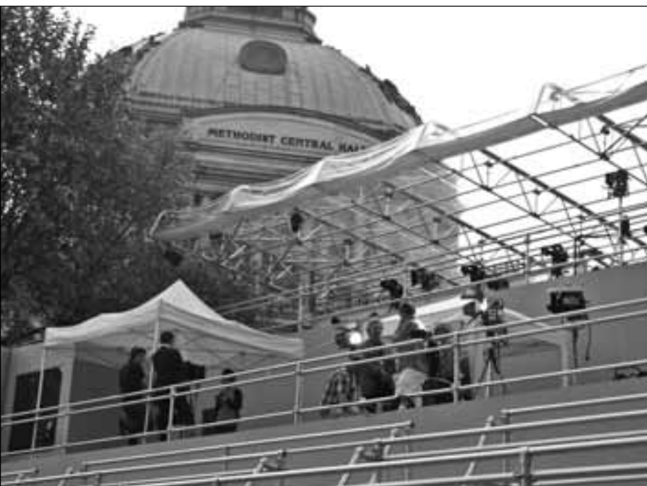
La iglesia metodista se convirtió en centro de transmisión del evento. A la derecha, la Abadía de Westminster, donde se realizó la boda