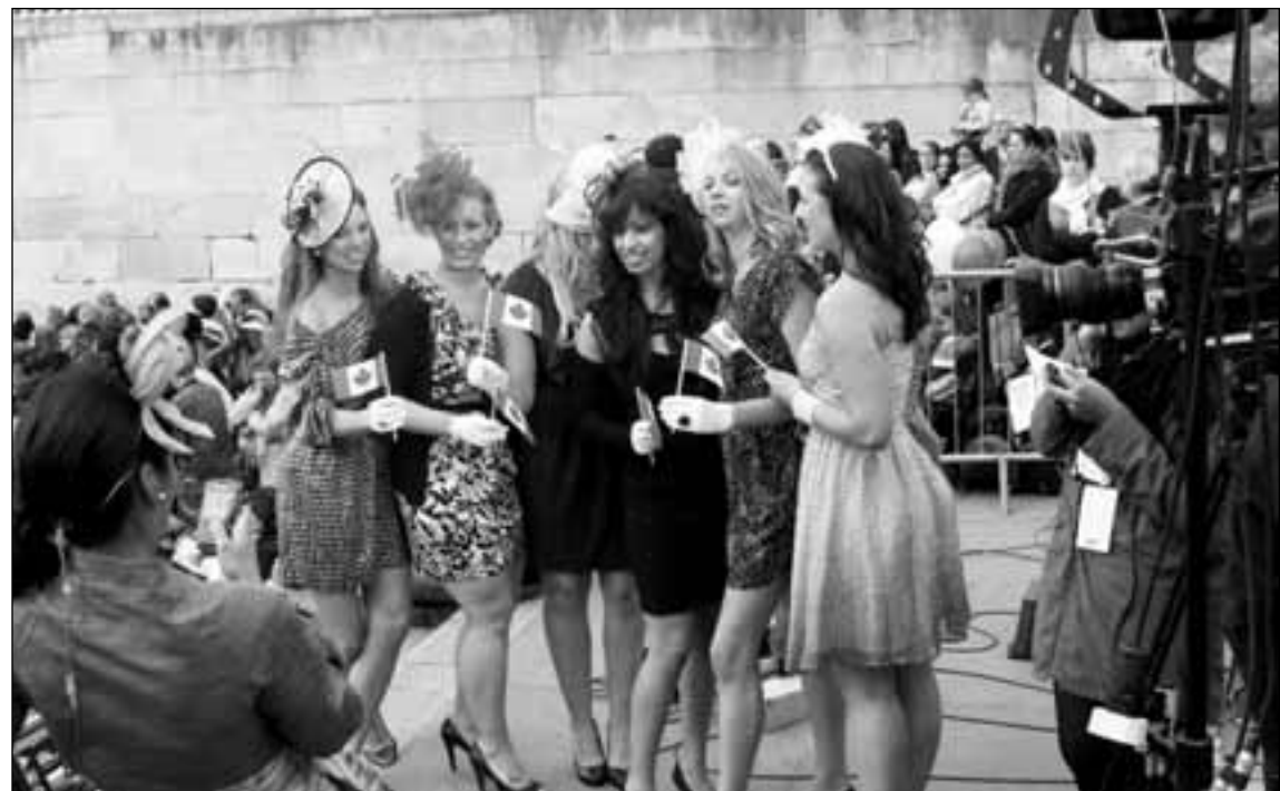
Guapas muchachas de Canadá.

Entre tantas ocurrencias de celebración nos llamó la atención una bastante creativa y lucrativa