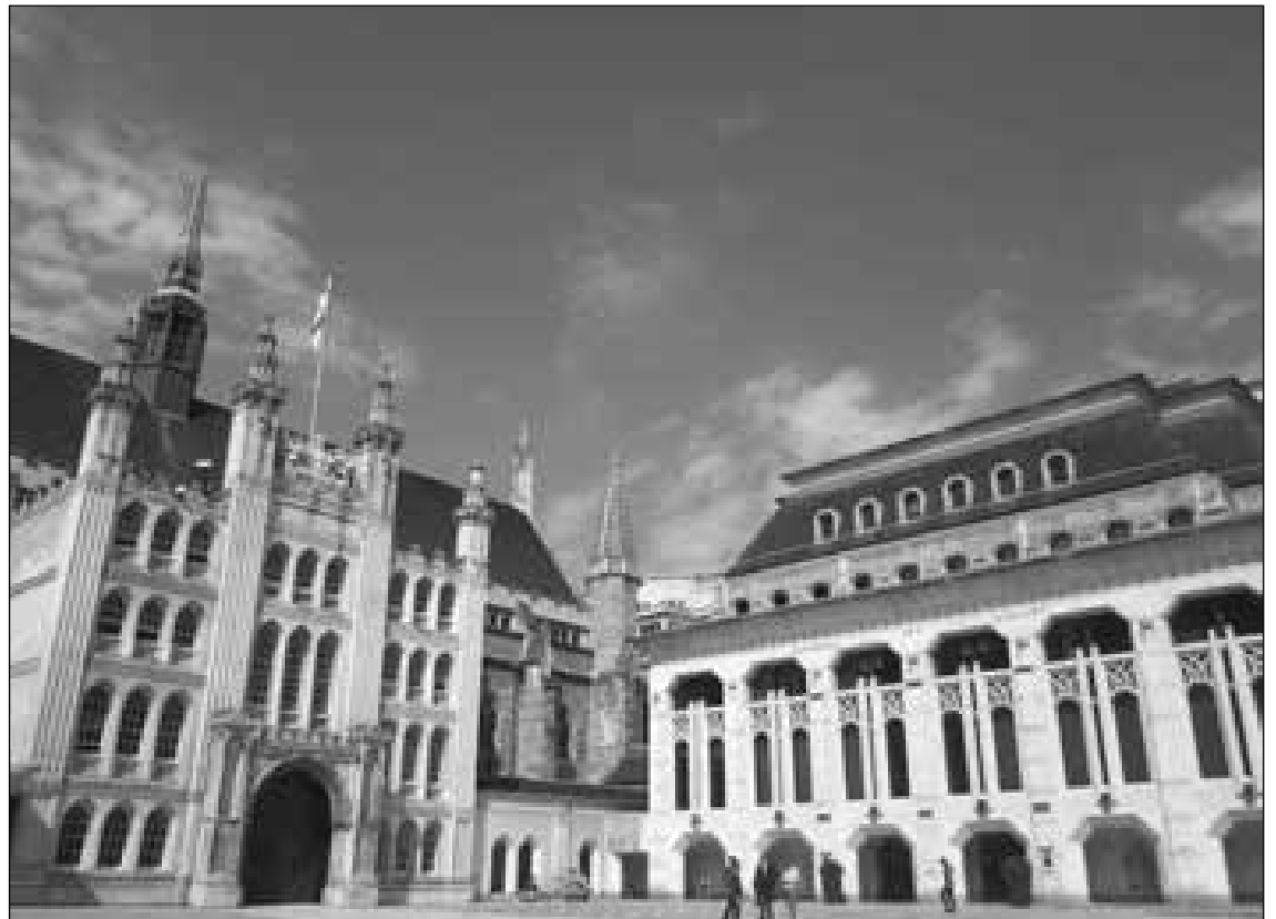
Toma de la magnífica Guidhall Art Gallery en la City de Londres.