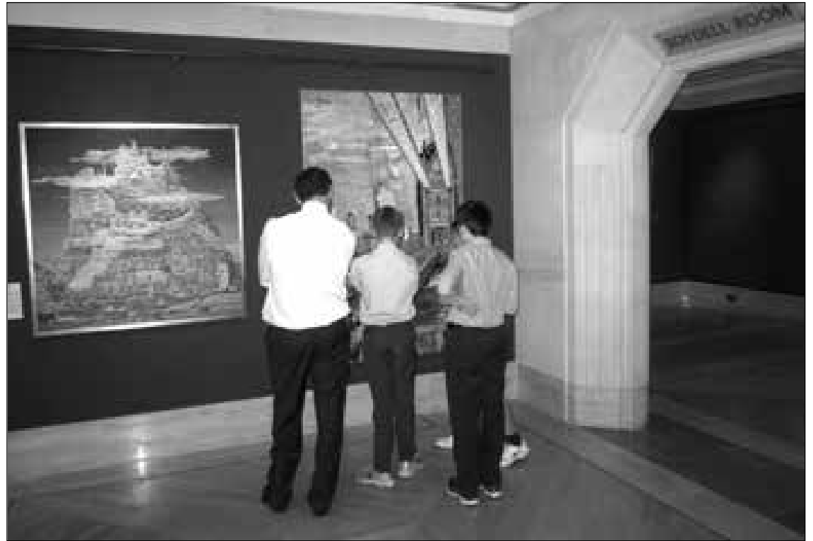
Estudiantes ingleses admirando el cuadro de Méntor Chico.

En todas las creaciones de Chico aparecen inexorablemente sus raíces andinas de su natal Guaranda las cuales han nutrido su cosmovisión y dan a sus cuadros una simbología y luminosidad mágico realista.