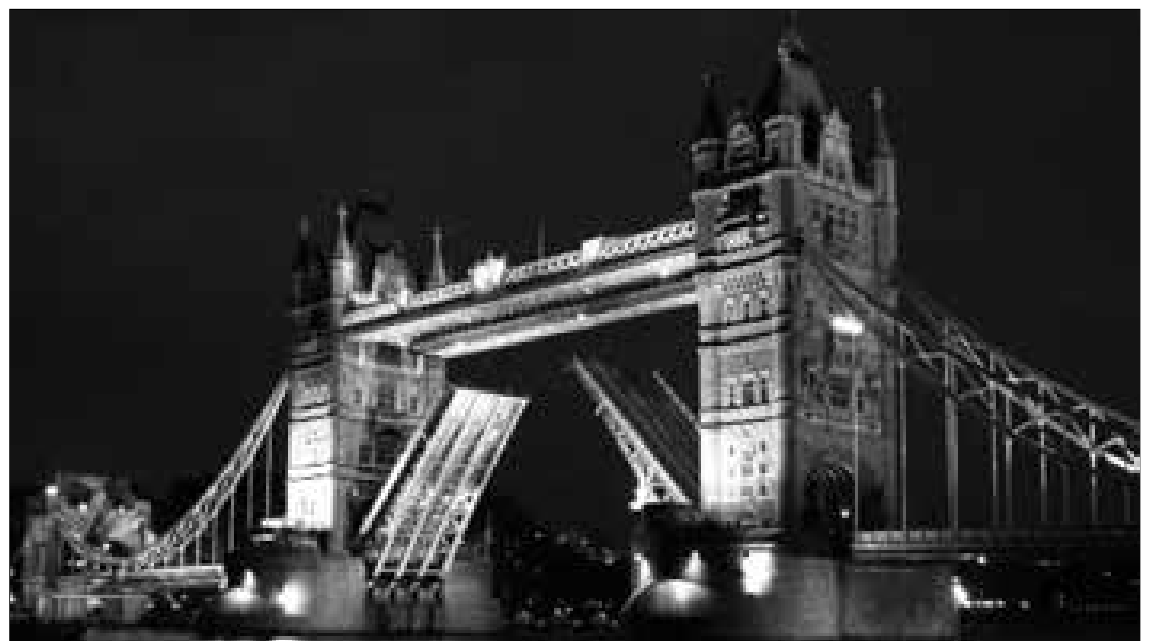
Este icónico puente de Londres durante la noche.