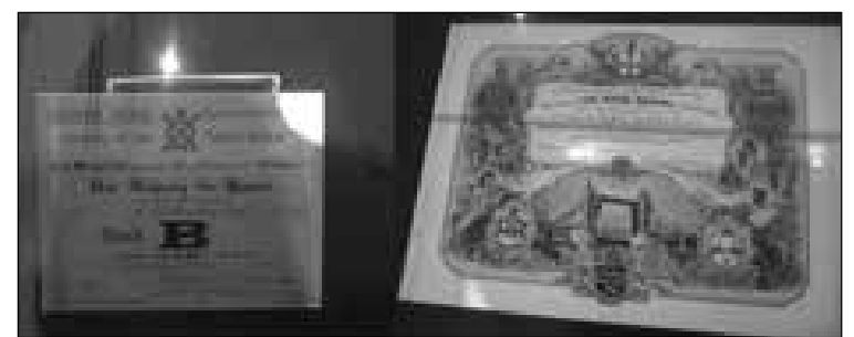
Documentos históricos de lo que fue la ceremonia de apertura del Puente de la Torre en 1894.3

uno de los detalles de este magnífico monumento de la arquitectura e ingeniería británica, único en el mundo. Mi intención ha sido yuxtaponer dos estilos arquitectónicos distintos: el histórico y el contemporáneo.