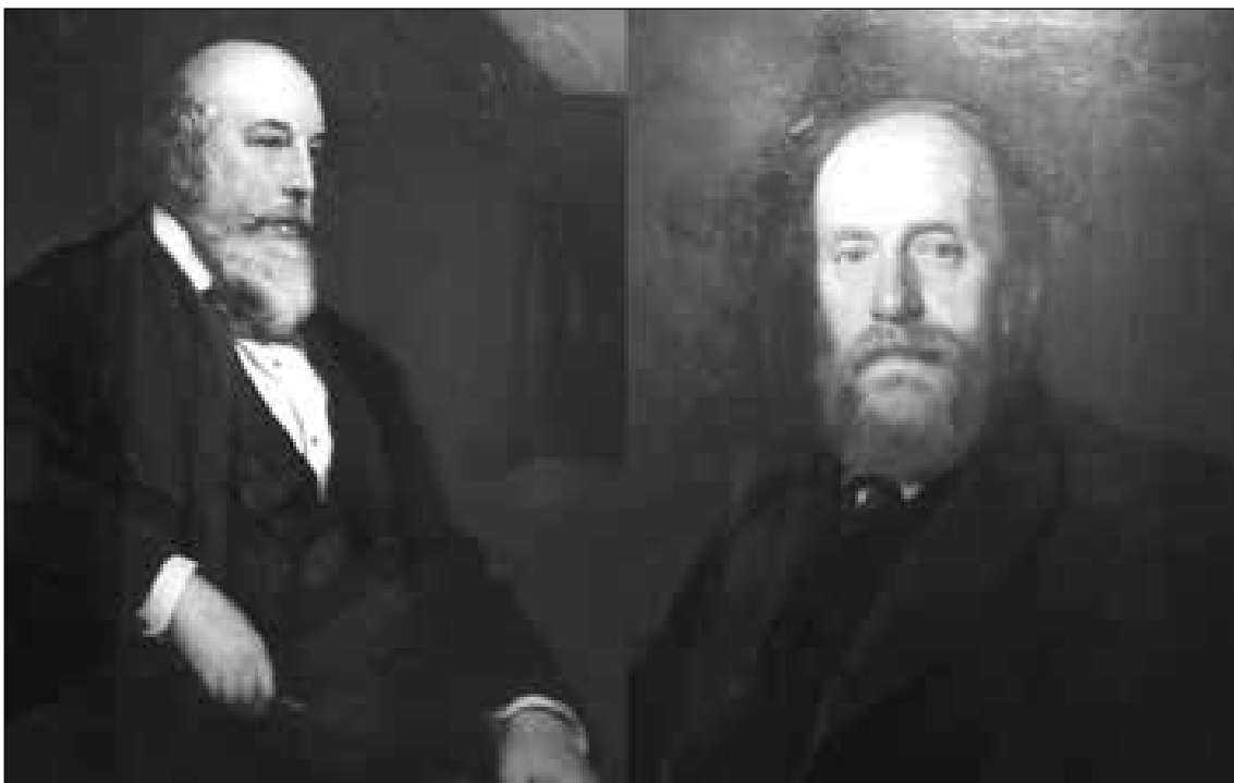
El arquitecto Sir Horace Jones y el ingeniero Sir John Wolfe Barry diseñaron el icónico Puente de la Torre.