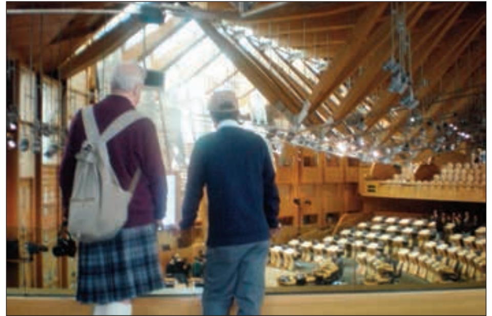
Interior del Parlamento escocés, la institución que podría bloquear la salida del Reino Unido de la Unión Europea.