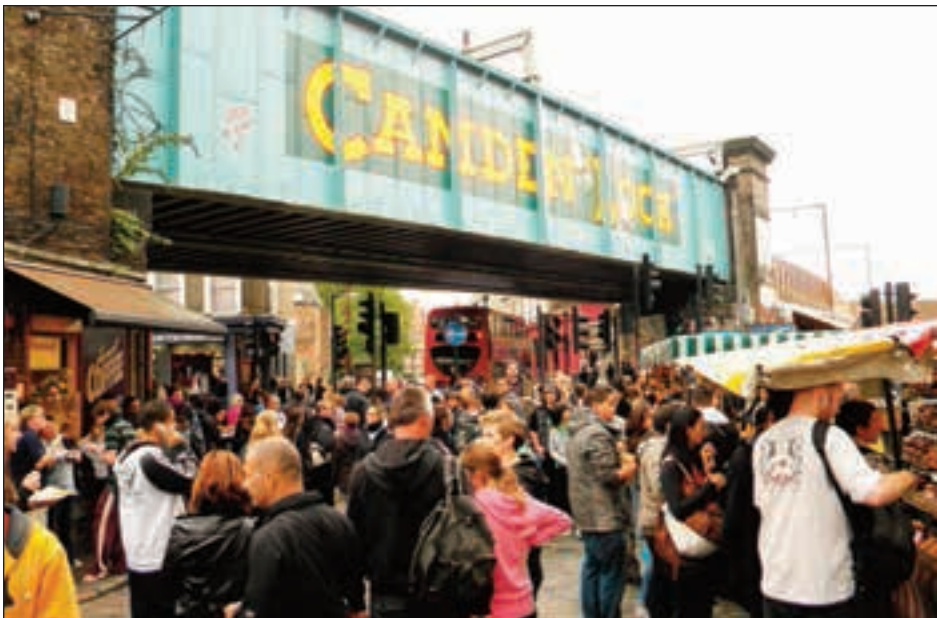
Incertidumbre reina en Londres, cuyos habitantes votaron en su mayoría por permanecer en la Unión Europea.

institución británica en la que el 29 de junio tendrá lugar el evento Foro de Inversiones al que asistirá el ministro ecuatoriano de comercio exterior, Juan Carlos Cassinelli.