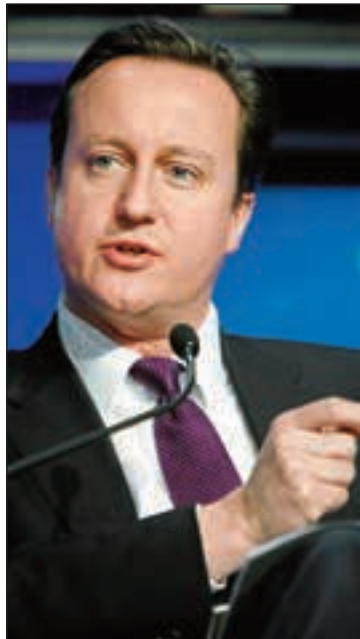
Primer Ministro David Cameron.

Una vez que se dieron a conocer los resultados del referéndum