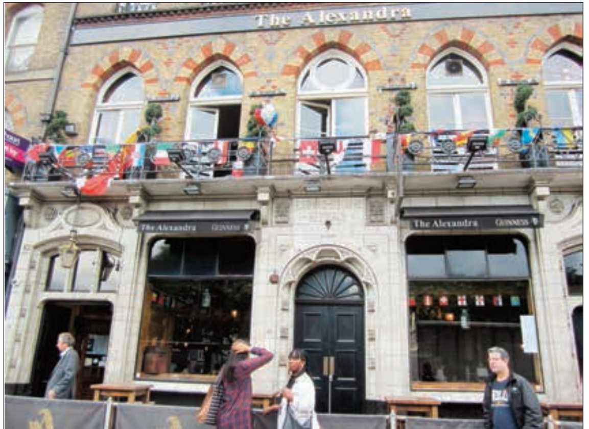
Tipico pub inglés donde se transmiten los partidos de la EuroCopa 2016.

Algo que no será tan fácil según Miriam González, quien antes del referéndum, dijo a "Daily Politics" que el proceso no sólo es largo y complicado sino que también el Reino Unido no tendrá un trato preferencial. Además,