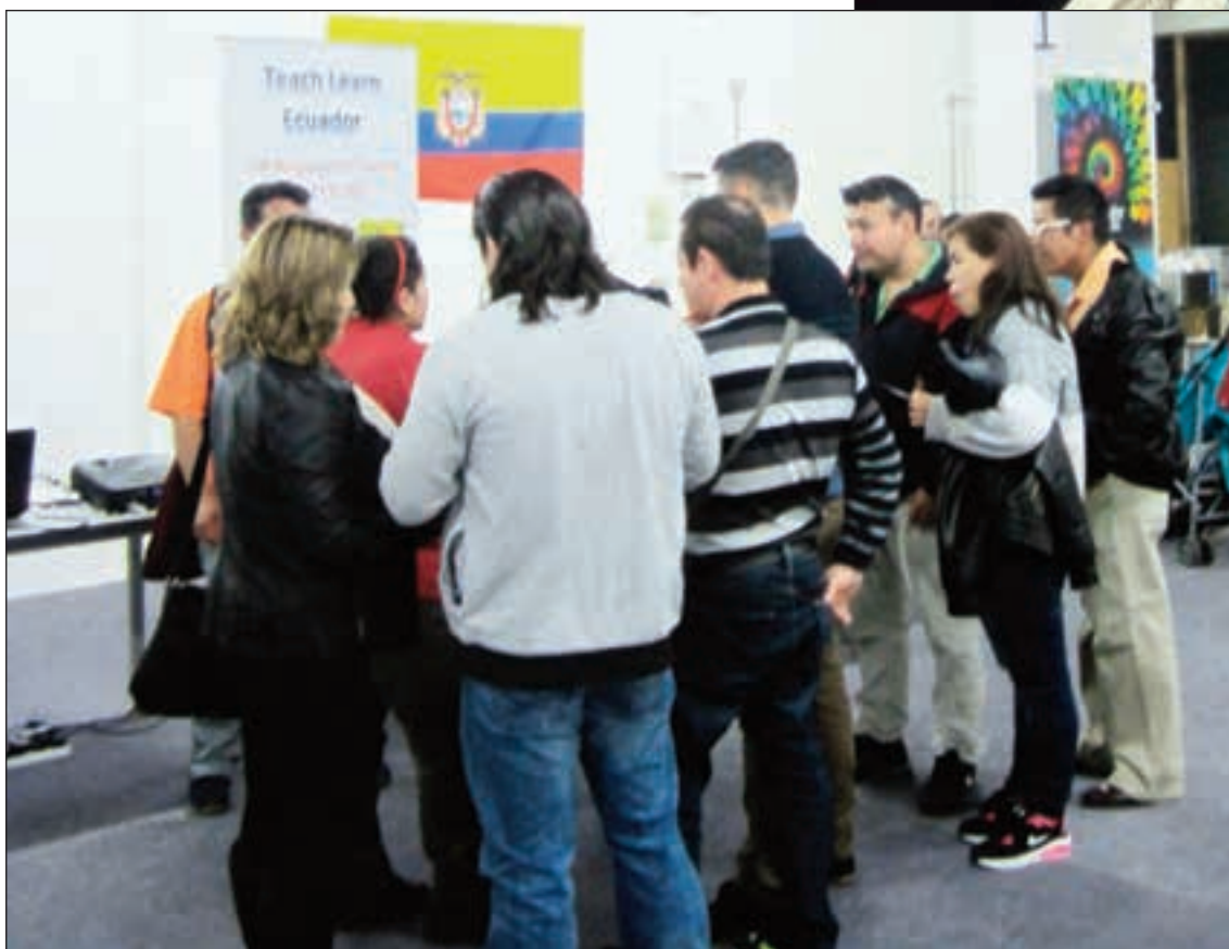
Más de 200.000 españoles residen en el Reino Unido, entre ellos ecuatorianos nacionalizados.

los británicos sintieron felicidad o decepción según votaron; pero fue la incertidumbre la que reinó en los dos bandos.